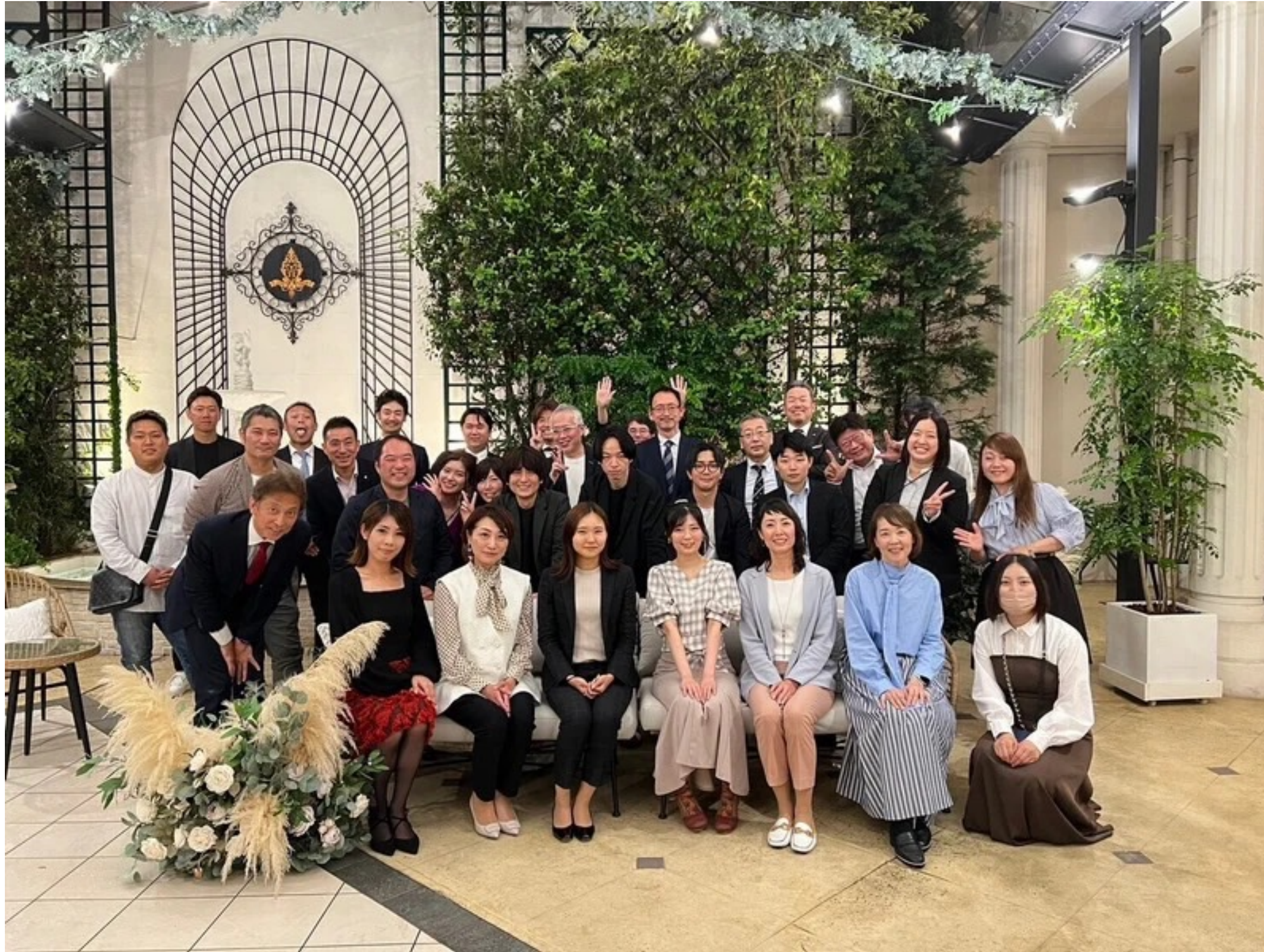
月1回の合同例会の実施。 ※首都圏は現在3ヶ月に1回。