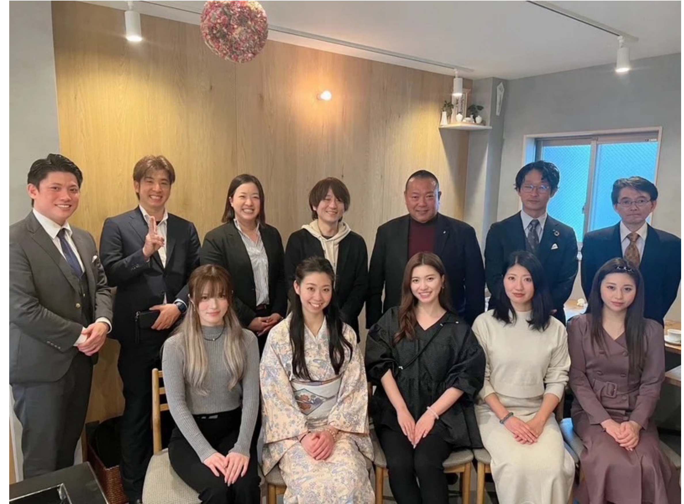
各支部、月1回のランチ会の実施。 ※現在、12支部で実施。